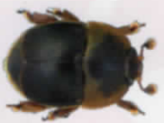
© Lyle J. Buss, University of Florida