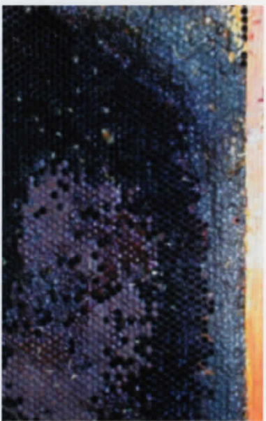
Cadre infesté par des larves du petit coléoptère des ruches